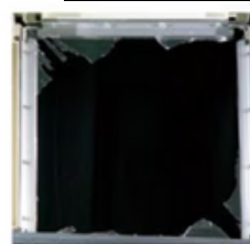
ガラスのみ （ガラス片が飛散）